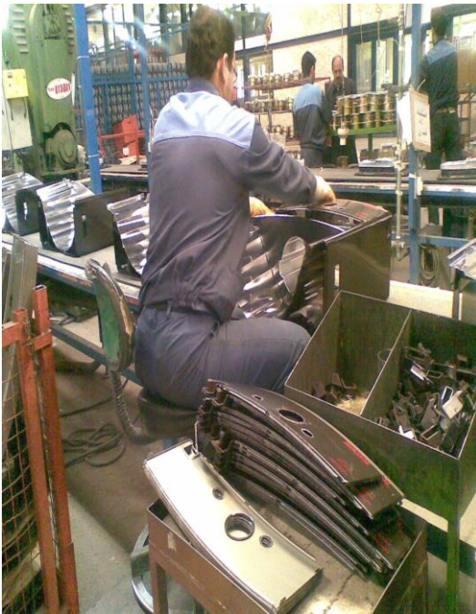
تهیه کننده :

کارشناس مهندسی بهداشت حرفه ای مرکز بهداشت شهرستان کرمان